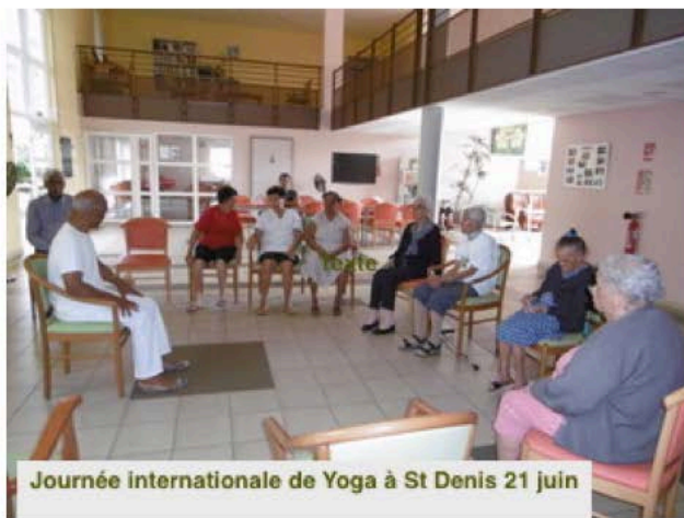
Journée internationale de Yoga à St Denis 21 juin