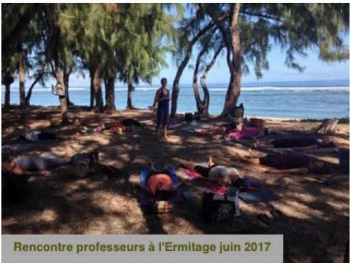
Rencontre professeurs à l'Ermitage juin 2017