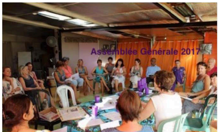
Assemblée Générale 2017