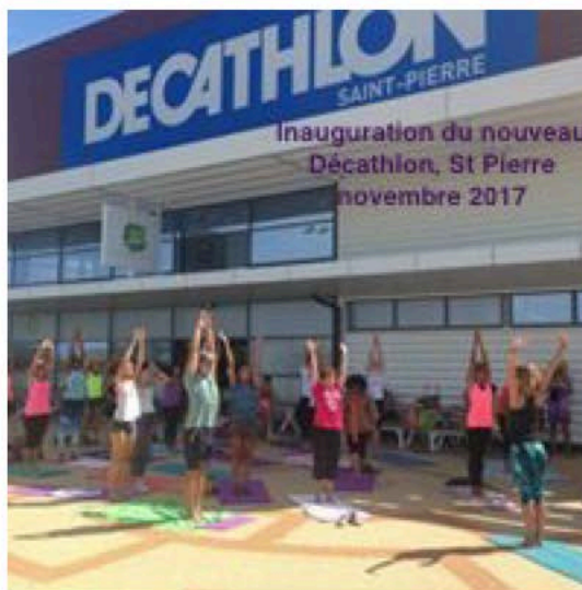
Inauguration du nouveau Décathlon, St Pierre novembre 2017