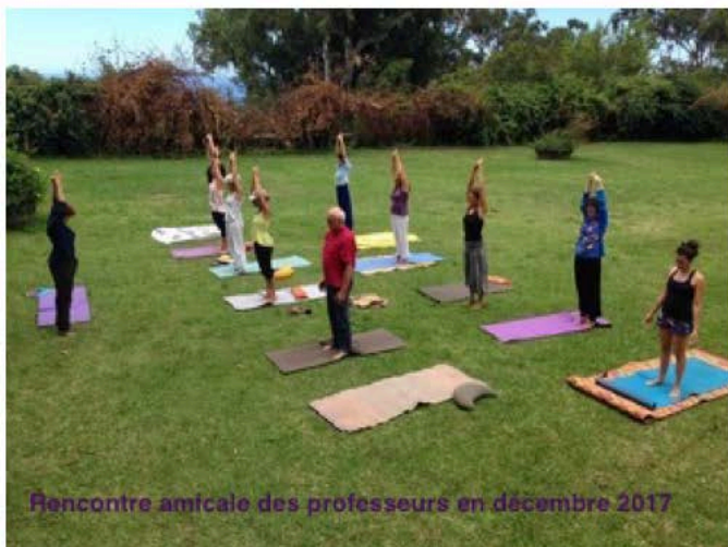
Rencontre amicale des professeurs en décembre 2017